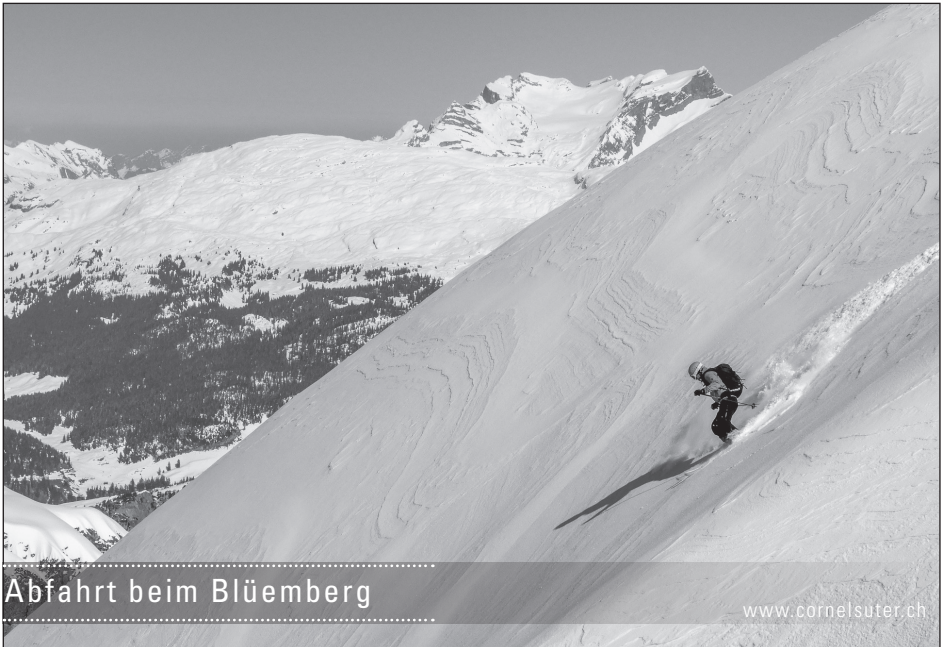
Abfahrt beim Blüenberg