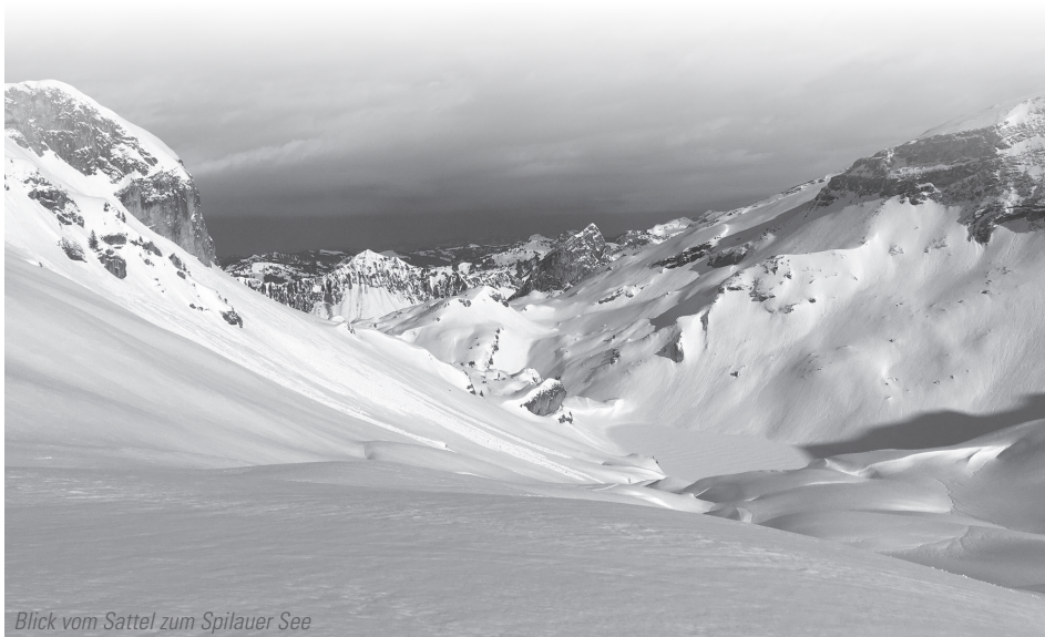
Blick vom Sattel zum Spilauer See